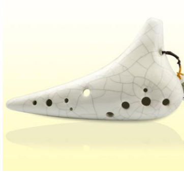
Ocarina céramique, 12 trous, en DO Majeur. *