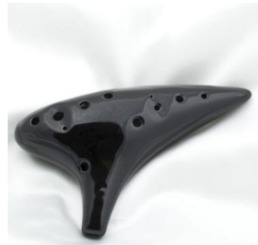
Ocarina 12 trous, en céramique, de chez STL Ocarina (livré depuis les USA)