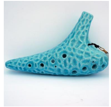
Ocarina bleu, en céramique, 12 trous, en DO Majeur. *