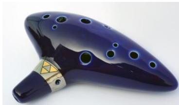
Ocarina 12 trous, en DO Majeur, La légende de Zelda. *