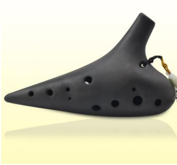
Ocarina 12 trous, en DO Majeur. *